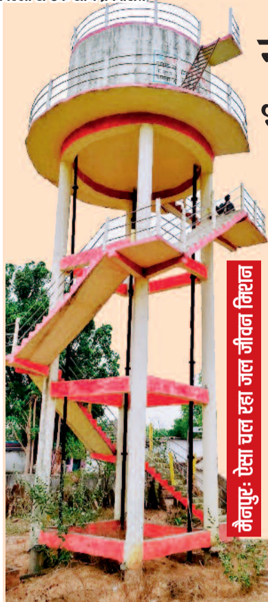
नैनपुर: ऐसा पल रहा जल जीवन निरहण

यह छोटा सा उदाहरण बताता है कि प्रकृति के लिए थोड़ी सी व्यवस्था भी कितनी बड़ी मदद बन सकती है। यदि हर व्यक्ति अपने घर या आसपास पक्षियों के लिए पानी रखे, तो गर्मी में कई जीवों की जान बचाई जा सकती है।