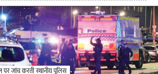
घटनास्थल पर जांच करती स्थानीय पुलिस

मेयर ने बताया दुख, कहा- कमी ऐसी घटना नहीं हुई