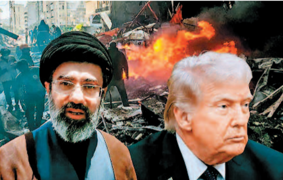
नाकाबंदी हटने तक कोई बातचीत नहीं : ईरान

धमकियों के बीच ट्रंप ने कूटनीति का रास्ता खुला रखने का संकेत भी दिया। उन्होंने बताया कि उनके प्रतिनिधि सोमवार शाम बातचीत के लिए पाकिस्तान की राजधानी इस्लामाबाद पहुंच रहे हैं। ट्रंप ने लिखा कि वे वहां एक समझौते के लिए बातचीत करेंगे, जिसे उन्होंने बहुत ही उचित और तर्कसंगत डील' करार दिया।