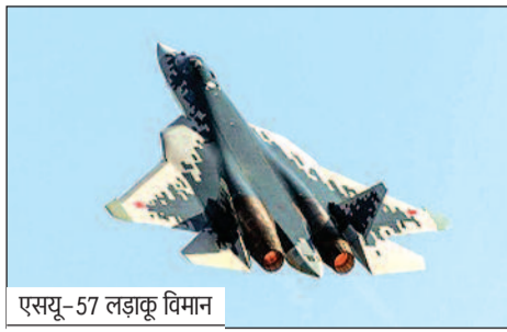
एसयू-57 लड़ाकू विमान